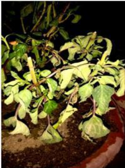
erhielt meine 109 Kombo Box 2015. Als ich meine kostbare

Hier teilt sie mit uns die positive Auswirkung vom CC1.2 Plant tonic und der Freude die sie erfahren hat, als sie in die Welt von Vibrionics geschritten ist.